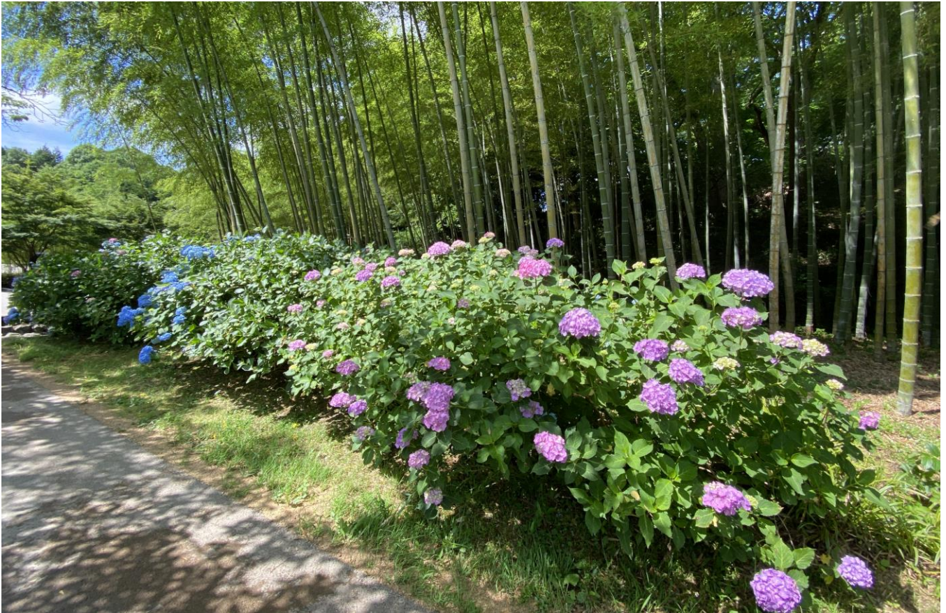
ひばの里 竹林「アジサイ」の様子（2022年6月22日撮影）