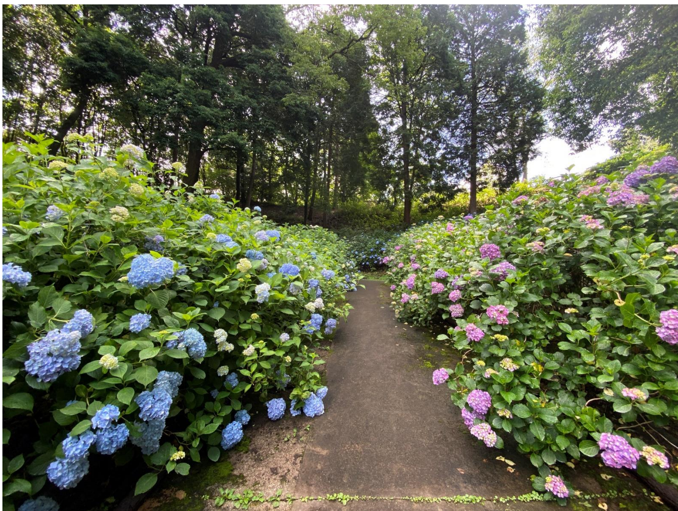
ひばの里 アジサイ園「アジサイ」の様子(2022年6月22日撮影)