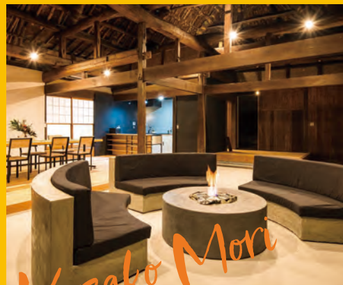
庄原市高野町下湯川

ちょっとした空き時間やWワークをお考えの方など、家事や仕事の合間に働きたい方、大歓迎!! 作業の流れ、清掃のポイントなど、スタッフが丁寧にレクチャーしますのでご安心ください。 仕事を通じて、家事にも役立つおそうじテクニックもGET!