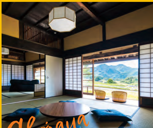
庄原市比和町三河内