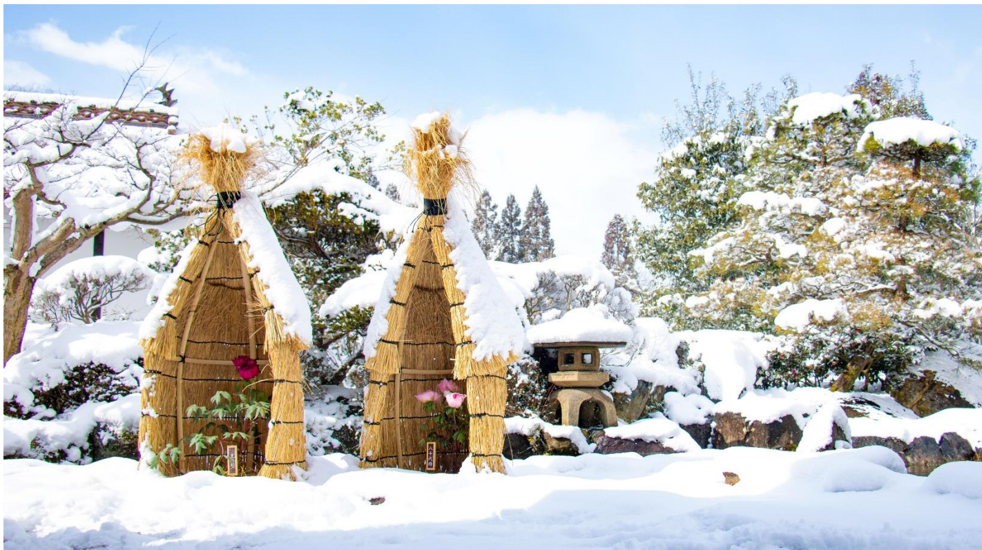
ひばの里 さとやま屋敷「冬咲きぼたん展」(2022年2月17日撮影)

今年で19回目となる「冬咲きぼたん展」を、2023年1月21日(土)より開催します。冬に咲くように開花時期を調整した色鮮やかな大輪のぼたんをひばの里さとやま屋敷へ展示、藁帽子(藁のこも)をかぶり、寒さに耐え凛と佇む「冬咲きぼたん」が冬のひばの里を彩ります。雪がしんしんと積もるなかで咲き誇る「冬咲きぼたん」の姿は、まさに冬の風物詩と言えます。