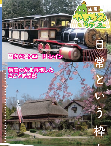
園内を巡るロードトレイン