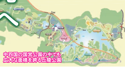
中四国の国営公園の中でも広大な面積を誇る丘陵公園

国営備北丘陵公園(15:45)＝(特別便)＝三次駅(16:20)＝高速乗合バス＝広島駅(18:12頃)