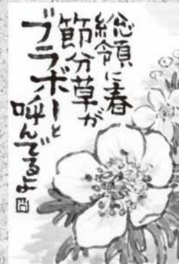
2023年 絵手紙コンテスト 最優秀賞 藤本 尚美さん

春の妖精たちを、写真として残したい方におすすめ。 日時●2月10日(土) 受付●13:00 13:30~15:00 講師●金山 一宏さん 料金●500円 (カメラをご持参ください。)