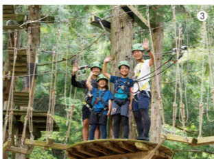
③頭と体を使って、コースを攻略!ゴールの後は達成感と充実感でいっぱい