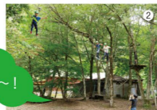
②参加しない人も、地上から応援でチームの一体感がアップ