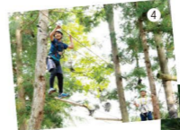
④普段とは違う真剣な表情を見せる子も