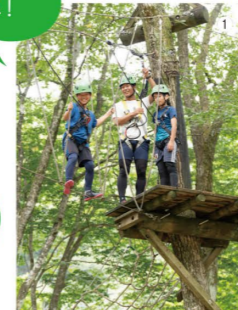
①家族や仲間と助け合いながらゴールを目指そう