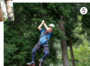
⑤ラストは75mのジップラインでクリア!