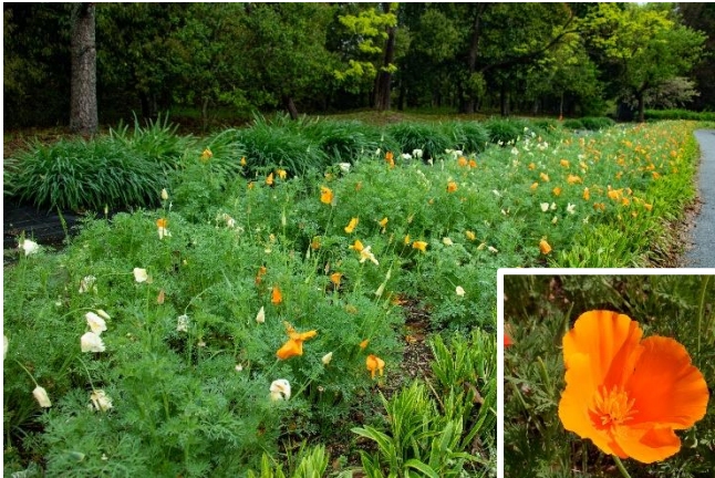
花の広場「ハナビシソウ」現在の開花状況 (2024年4月24日撮影)