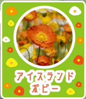
アイストラッド ポピー