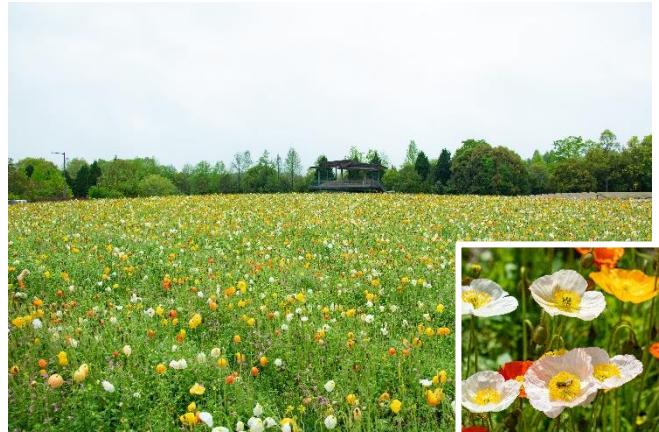
花の広場「アイランドポピー」現在の開花状況 (2024年4月24日撮影)