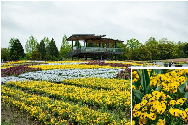
花の広場「ビオラ」現在の開花状況 (2024年4月24日撮影)