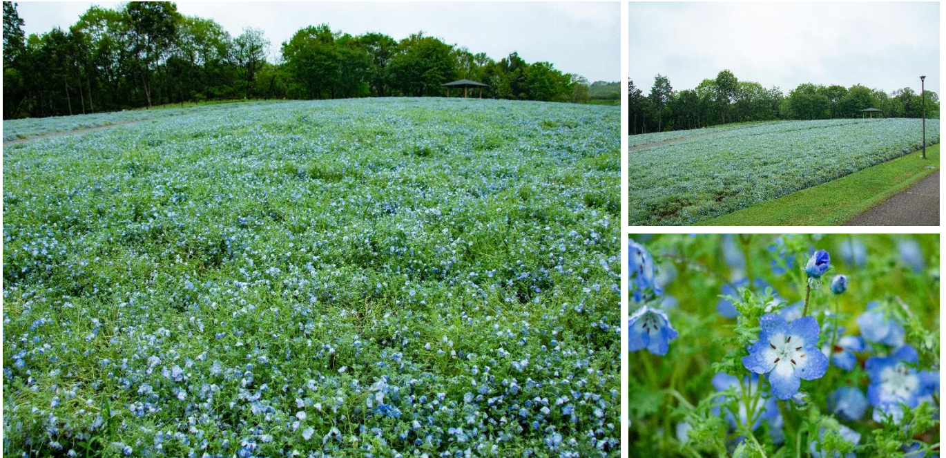
みのりの里 ピクニック広場「ネモフィラ」の現在の開花状況(2024年4月24日撮影)