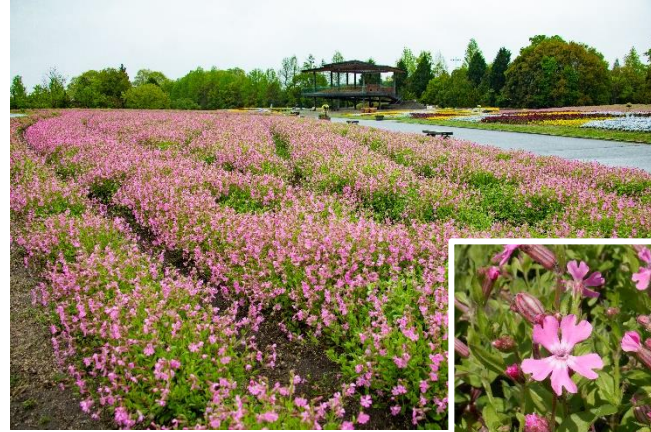
花の広場「桜ナデシコ」現在の開花状況 (2024年4月24日撮影)