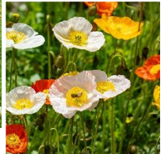
アイランドポピー